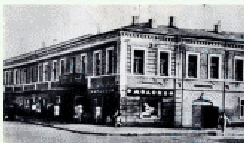
Тула. Дом, где родился педагог.

Константин Дмитриевич Ушинский – знаменитый русский педагог родился в Туле. В родной семье получил хорошее воспитание.