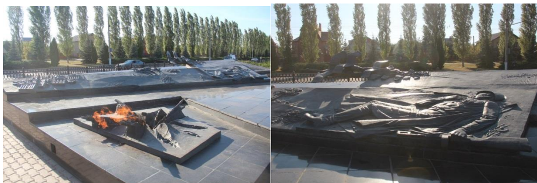
Мемориальный комплекс «Курская дуга»