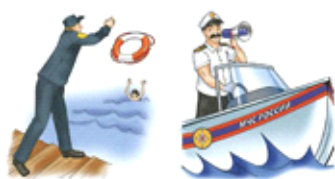
СПАСАТЕЛИ НА ВОДЕ

Велибеков Где бы ни случилась беда, спасатели придут на помощь везде. Несчастные случаи могут произойти и на воде. Спасатель должен уметь всё – и хорошо плавать, и быстро оказывать первую помощь.