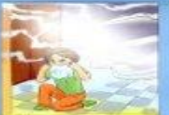
В задымленном помещении дышать через мокрую ткань