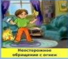
Неосторожное обращение с огнем