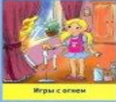
Игры с огнем