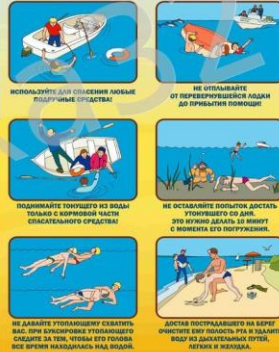
Используйте для спасения любые подручные средства!