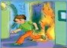
Если потушить невозможно, срочно покинуть помещение