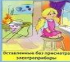
Оставленные без присмотра электроприборы