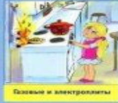
Газовые и электроплиты