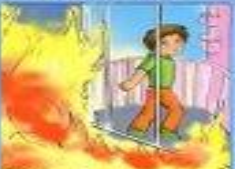
Если выйти невозможно, найдите источник свежего воздуха, выйдите на балкон