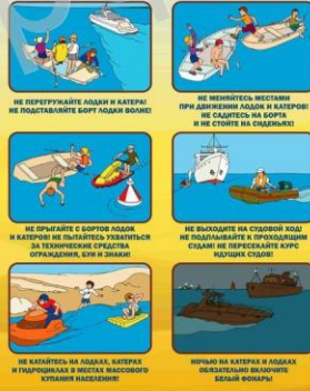
Не перегружайте лодку и катер! Не подсаживайте борт лодки волной!