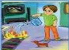
Мелкое возгорание потушить подручными средствами