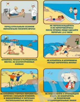
Перед купальным сезоном обязательно посетите врача!