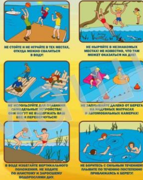
Не стойте и не играйте в тех местах, откуда можно скатиться в воду!