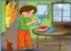
Вызвать пожарных по телефону 01