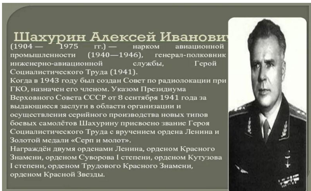
Народный комиссар авиационной промышленности Шахурин А. И