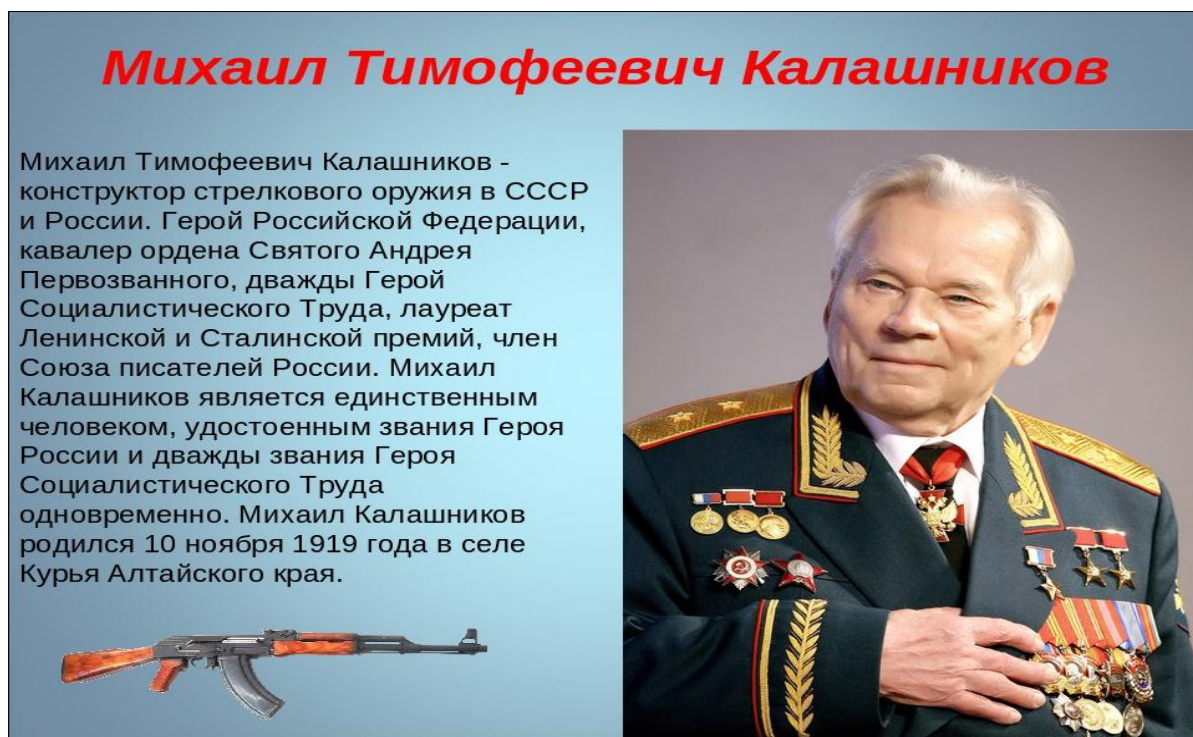
Конструктор-оружейник Михаил Тимофеевич Калашников