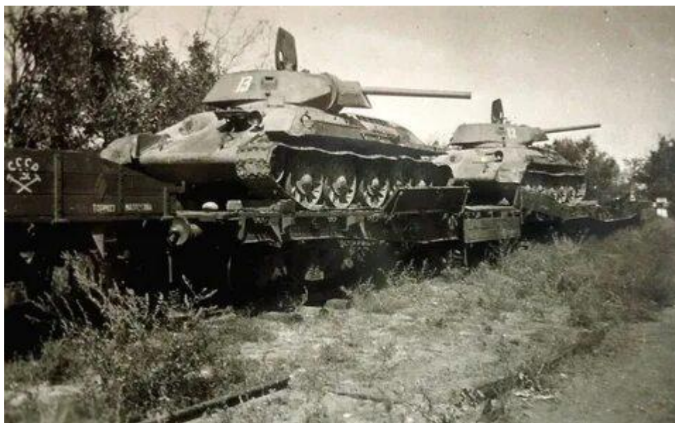
T-34 на жд-платформах