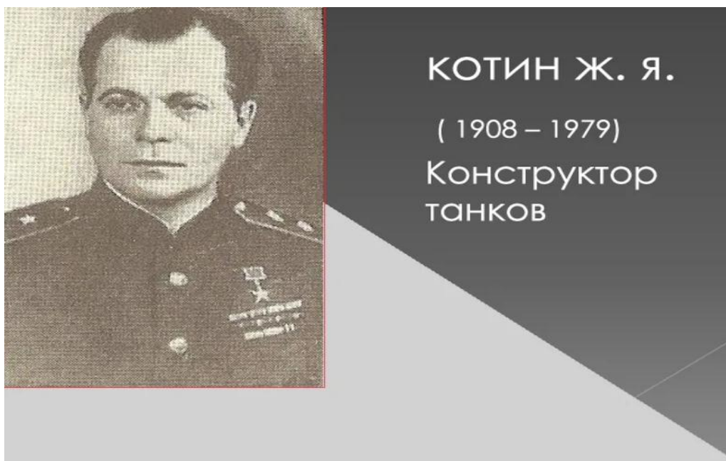
Конструктор танков Котин Ж. Я.