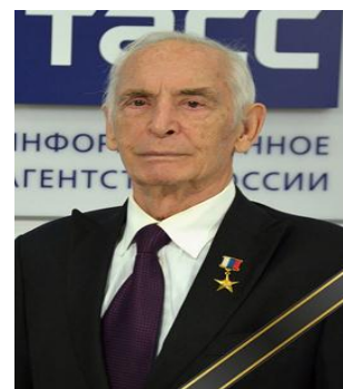
Василий Семенович Лановой