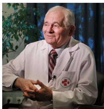
Леонид Михайлович Рошал