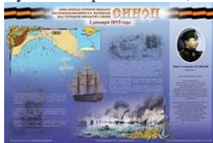
Синопский морской бой

Весть об освобождении Москвы воодушевила всю страну. Были созданы условия для восстановления государственной власти в России. Благодарные потомки открыли в столице России памятник. На его гранитном постаменте бронзовыми буквами начертано: «Гражданину Минину и князю Пожарскому благодарная Россия, лета 1818 г.»