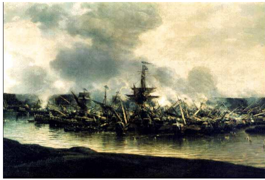
Морской бой у Тендры

Ф. Ф. Ушакова в России прозвали «морским Суворовым».