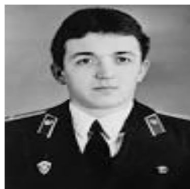
Дата смерти: 11 мая 1986 (23 года)