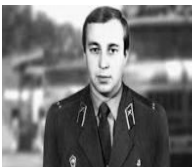
Дата смерти: 11 мая 1986 (23 года)