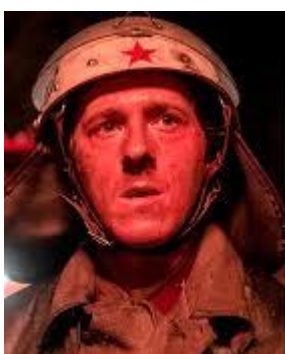
Дата смерти: 13 мая 1986 (25 лет)