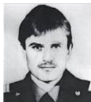
Дата смерти 16 мая 1986 ( 23 года)